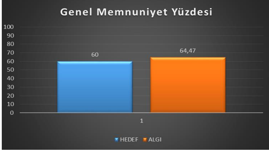
Grafik 4: Çalışan Genel Memnuniyeti