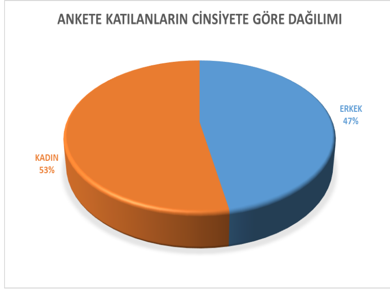
Grafik 5: Velilerin Cinsiyetlere Göre Dağılımı

Veli memnuniyet anketi 4 ana başlık ve 13 sorudan oluşmaktadır. Ankete 38 velimiz katılmıştır. Genel memnuniyet oranı %69'dur.