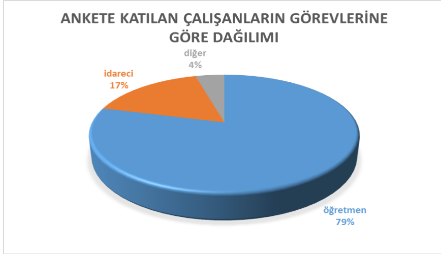
Grafik 3: Çalışanların Görevlerine Göre Dağılımı

Çalışan memnuniyet anketi 4 ana başlık ve 13 sorudan oluşmaktadır. Ankete 19 personelimiz katılmıştır. Genel memnuniyet oranı %64,47' dir.