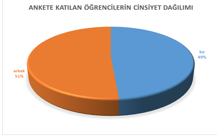
Grafik 2: Öğrencilerin Cinsiyetlere Göre Dağılımı